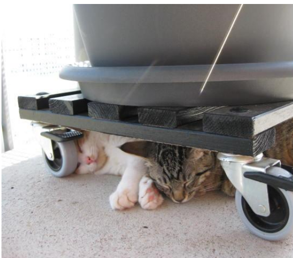
Wieder in Sicherheit, auf dem Balkon.