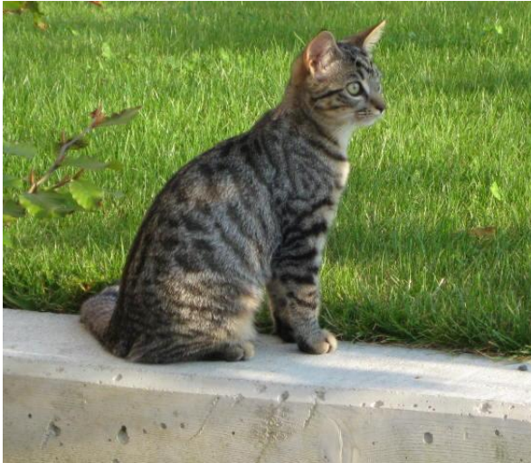
Mein kleines süßes Tigerli *schmatz* *drück*